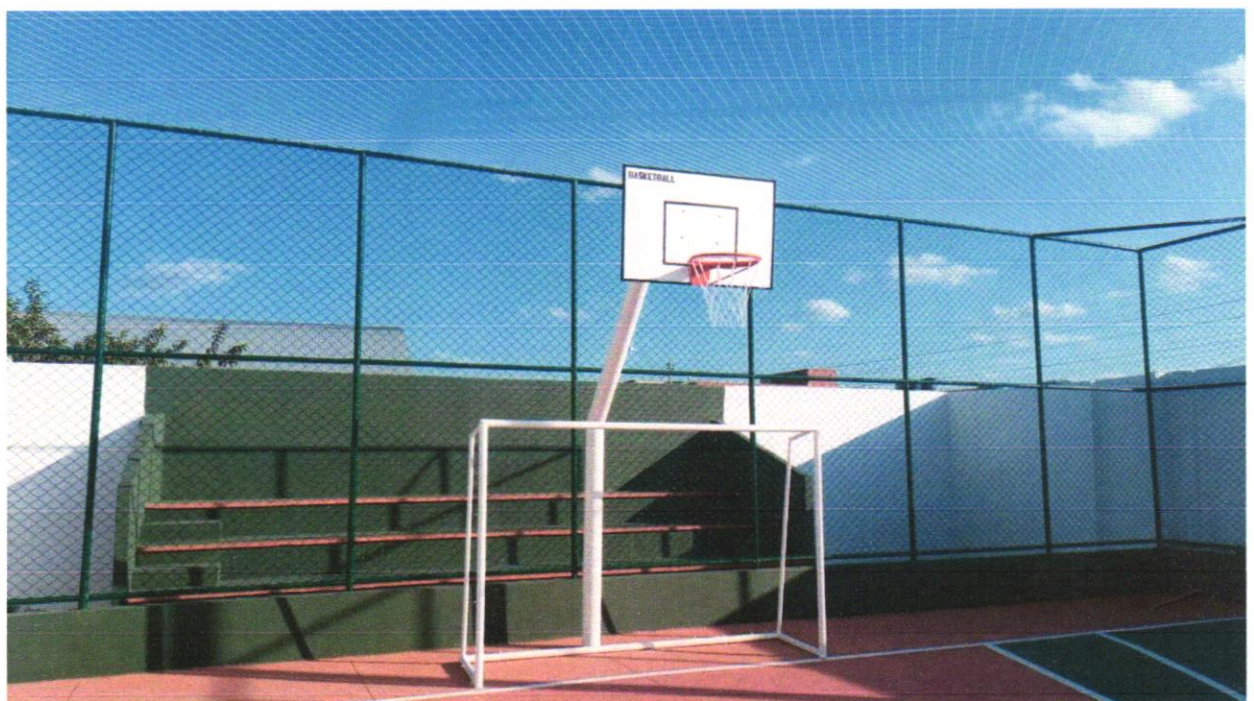
Foto 04 - Estrutura metálica fixa, p/ tabela em aço com aro e cesta p/ basquete, padrão oficial, em tubo galvanizado d=5" - instalada