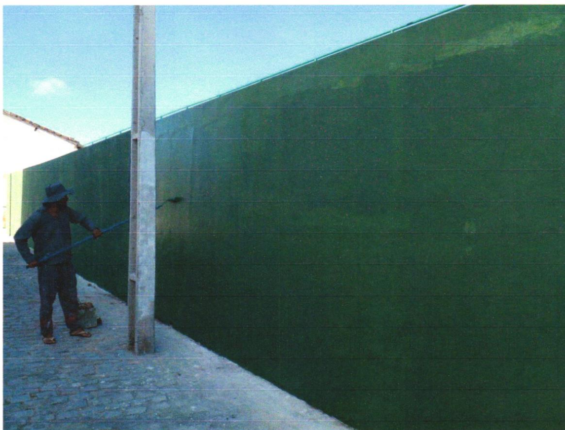
Foto 07 - PINTURA DE PISO COM TINTA ACRÍLICA, APLICAÇÃO MANUAL, 2 DEMÃOS, INCLUSO FUNDO PREPARADOR. AF_05/2021