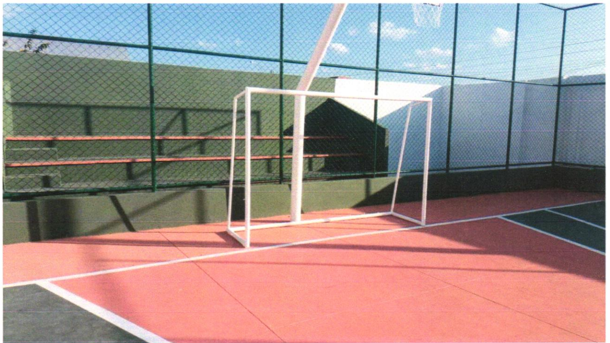
Foto 03- Traves oficial para futebol de salão 3x2m em aço galv.3", com requadro e redes de polietileno fio 4mm (conjunto p/futsal)