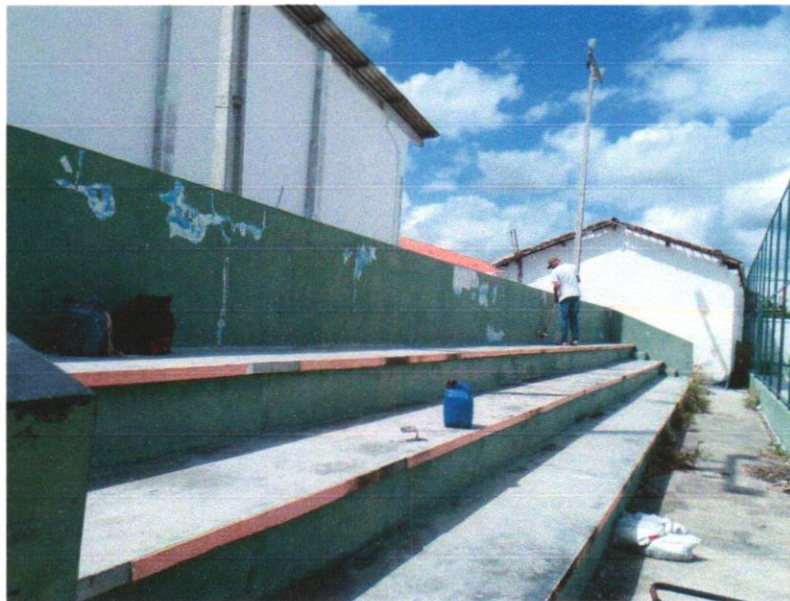
Foto 01 - LIMPEZA MANUAL